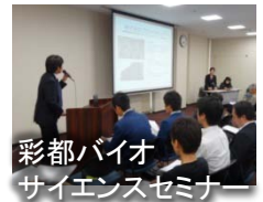
彩都バイオサイエンスセミナー