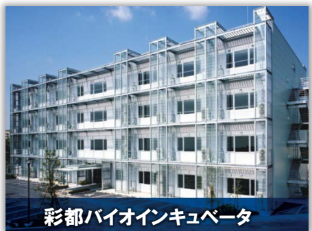
彩都バイオインキュベータ