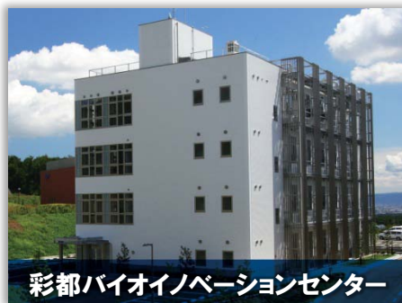
彩都バイオインベーションセンター