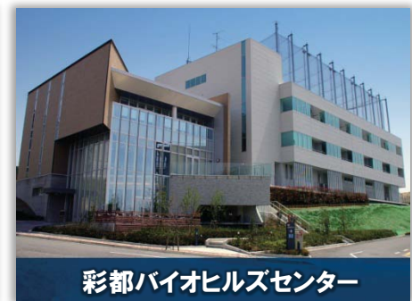
彩都バイオヒルズセンター